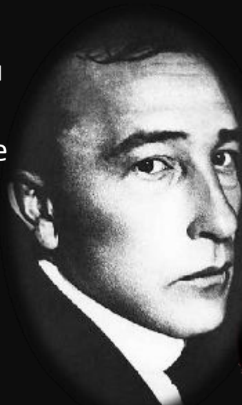
Б. В. Савинков